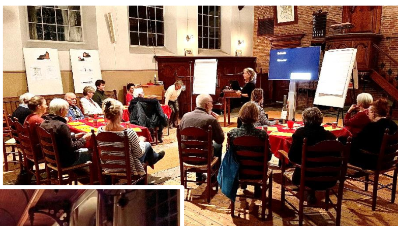
Workshop Creatief denken