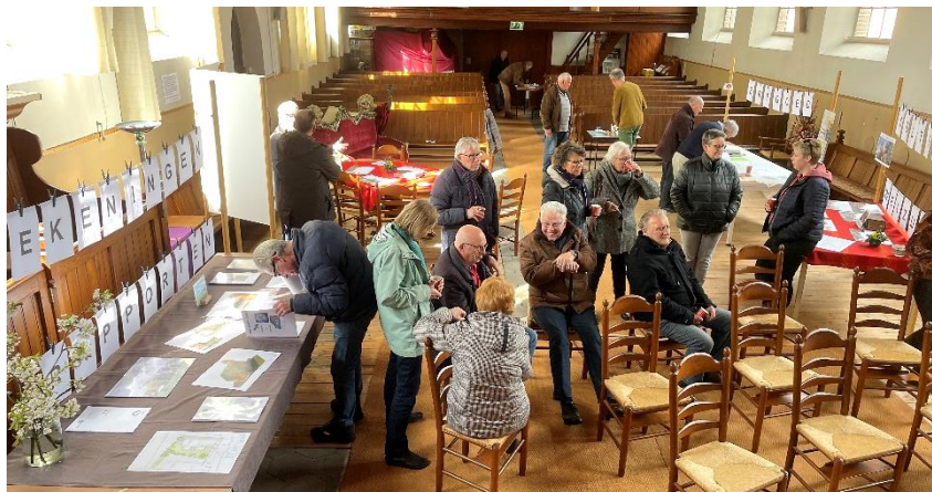
Open dag 2022

Er is een Open Huis geweest op 8 en 9 april waarop we positief terugkijken. De grote zaal van de Antonius hebben we gevuld met vele marktkraampjes met diverse informatie en rapporten. Er is lof voor het vele werk en de bezoekers waren over het algemeen positief over de plannen. Veel plezier gaven de gesprekken op de "levende bank"!