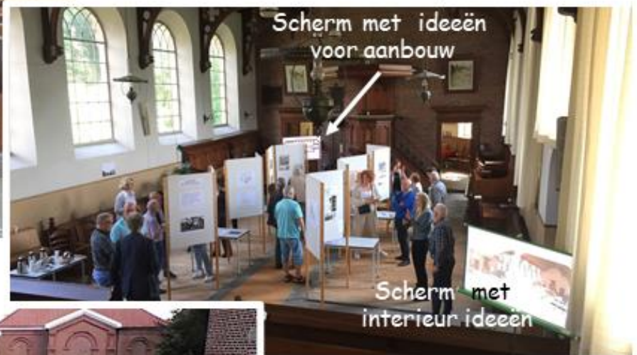
Scherm met ideeën voor aanbouw