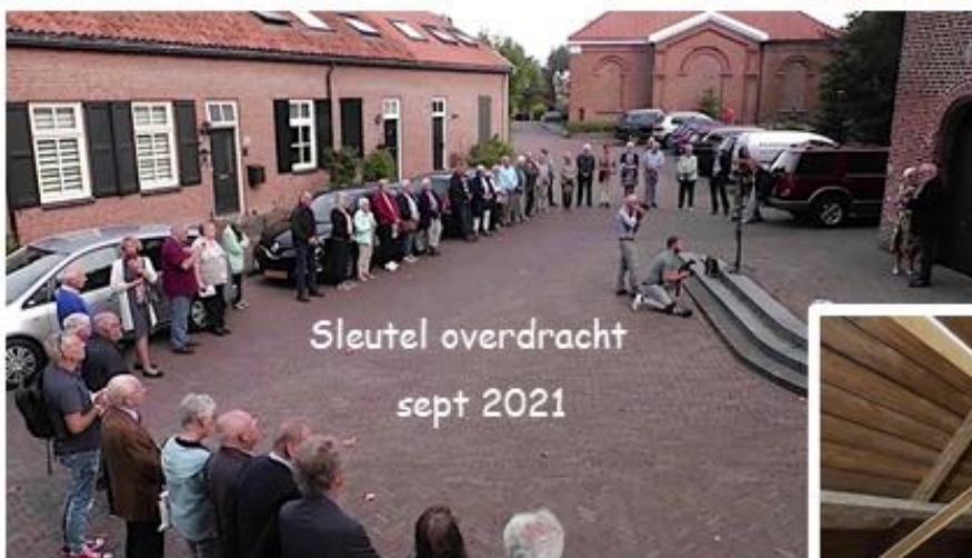
Sleutel overdracht sept 2021