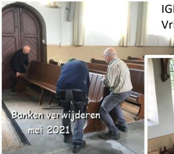
Banken verwijderen mei 2021